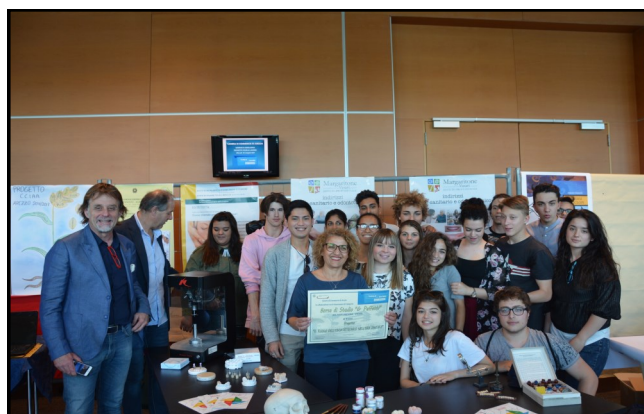
PREMIAZIONE DELL'ISTITUTO VASARI PRESSO LA CAMERA DI COMMERCIO DI AREZZO